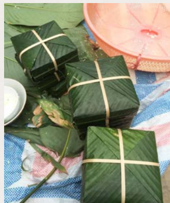
自作したベトナムお正月の伝統的な料理「バインチュン(Bánh chưng)」