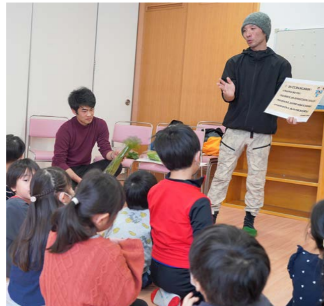
保育所食育活動より