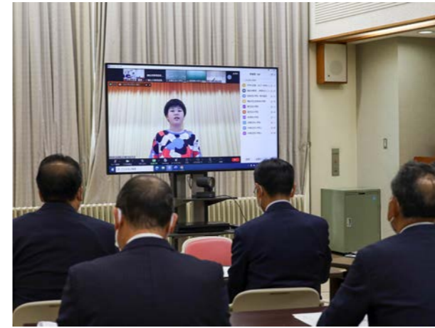
⑩ 11月2日(木) ④ 役場

稚内地区防犯協会連合会が防犯活動に尽力し犯罪の防止に功労があったと認められたことにより、今年度の「全国防犯功労団体表彰」に輝きました。 稚内地区防犯協会連合会は、昭和31年より、稚内、猿払、利尻、礼文にある防犯協会の上部団体です。 表彰状が贈られたことに伴い、各地区防犯協会においても連合会からの報告を兼ねて猿払村防犯協会へ表彰状と記念品が贈呈されました。