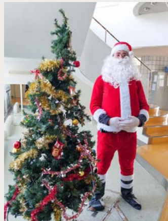
サンタに扮して中学校へ!