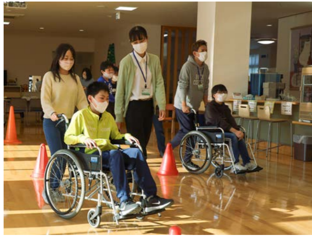
⑩ 12月6日(水) ④ 楽楽心