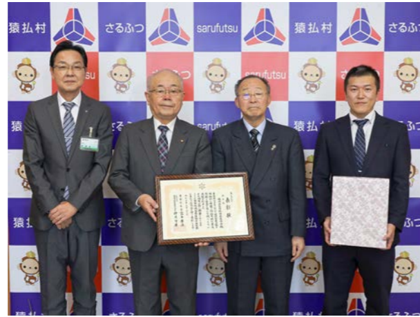
⑩ 12月4日(月) ④ 役場

浜鬼志別小学校5、6年生が福祉学習として車いす体験・高齢者疑似体験を行いました。 まずは、楽楽心職員が施設の案内をし、その後は「介護の大変さ」「小規模多機能型居宅介護施設に泊まるにはどれくらいお金がかかるのか」などの質問を児童が投げかけました。 車いす体験や高齢者疑似体験では、動きに制限がかかる不自由さを体験し、からだの不自由な方や高齢者への理解を深めました。