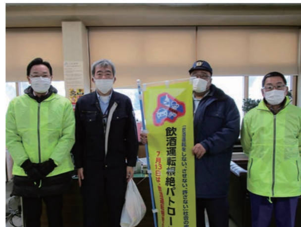
⑩ 12月8日(金) ④ 村内各地

地域おこし協力隊員が保育所の食育活動の一環として、猿払産野菜についてクイズを交えながら子どもたちに紹介しました。施設園芸事業では、厳冬期にビニールハウスでほうれん草や小松菜等を無加温栽培しています。 同日の給食では、猿払産野菜を使った「ほうれん草ともやしのナムル」が提供され、子どもたちは、野菜の知識と理解を深めながら、寒さに当たって甘くなった猿払産のほうれん草を美味しく食べていました。