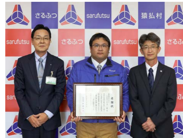
⑩ 11月22日(水) ④ 役場

猿払村交通安全運動推進連絡協議会により、年末にかけての飲酒運転防止、冬道の安全運転注意喚起のため、村内各事業所や飲食店等32か所を訪問し、パンフレット等の配布をすることで交通安全の啓発を促す、交通安全年末警戒が行われました。 この啓発活動は、年末の時期の降雪による路面状況の悪化や、年末年始を迎える飲酒機会の増加に伴う交通事故が懸念されることから行われています。