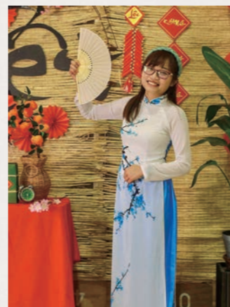
伝統的なアオザイ姿で