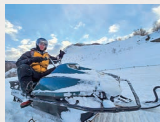
スノーモービルも体験